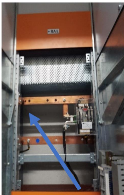
Foto 1 Ontbrekende aardverbindingen