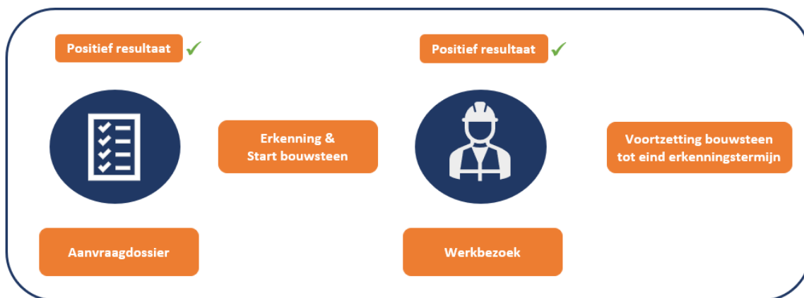
Figuur 5: werkbezoek in relatie tot erkenning

Samengevat ziet de periode van erkenning er als volgt uit: